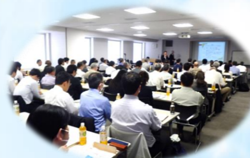
▲ 令和6年度 第1回 技術管理部会（社内技術講習会）

国土交通省／近畿地方整備局 地方公共団体等／大阪府・滋賀県・兵庫県・奈良県・和歌山県 ほか 桜井市・大和郡山市・東大阪市・茨木市 神戸市・津市・豊中市・八尾市 ほか 独立行政法人／都市再生機構・水資源機構 ほか 公益法人等／NEXCO西日本・本州四国連絡高速道路 ほか