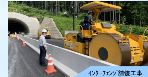
インターチェンジ舗装工事