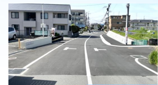
道路詳細設計(道路拡幅)