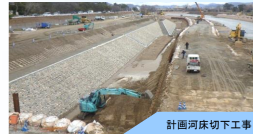
計画河床切下工事