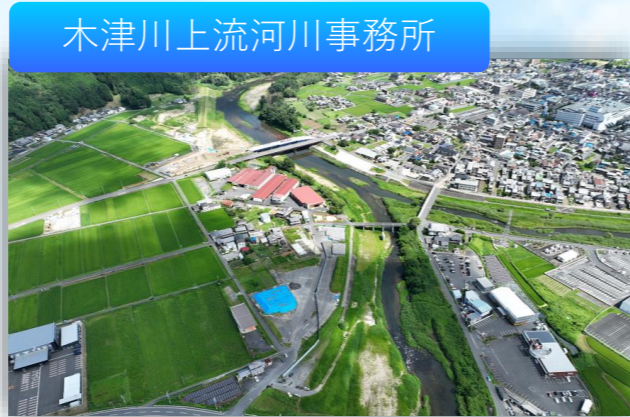
木津川上流河川事務所