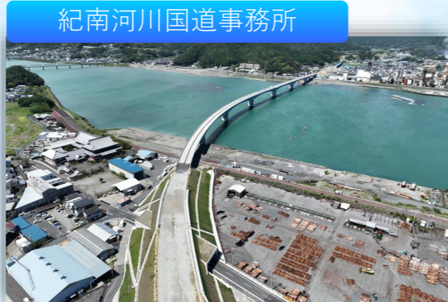
紀南河川国道事務所