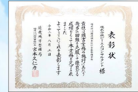
令和2年度 福井河川国道事務所長表彰