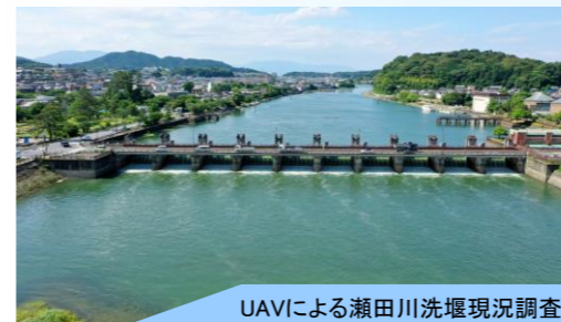
UAVIによる瀬田川洗堰現況調査