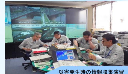
災害発生時の情報収集演習